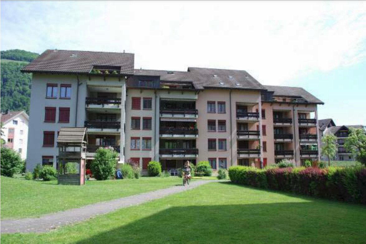
Aemättlihof in Stans (vor Sanierung)