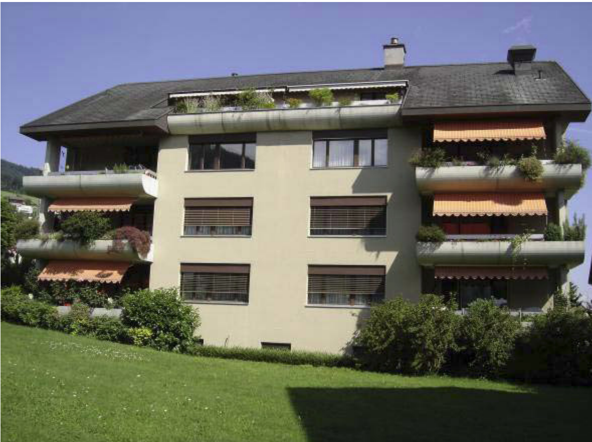
Mattli in Hergiswil (vor Sanierung)