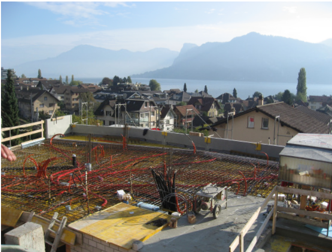
Rohbauarbeiten / Leitungsdschungel