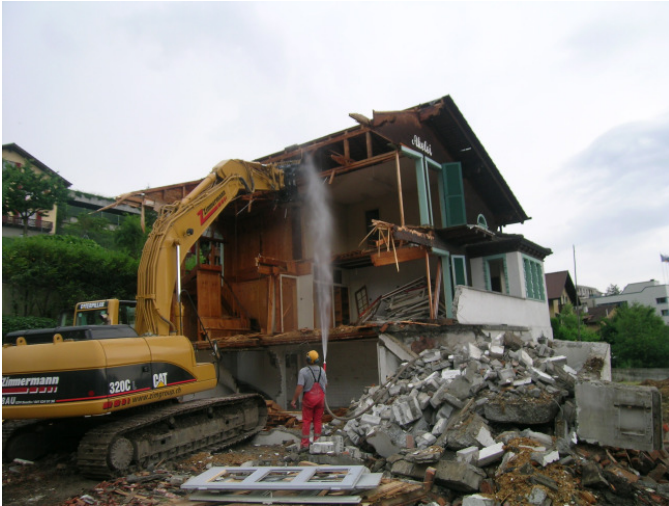
Abbruch EFH, Baujahr ca. 1940