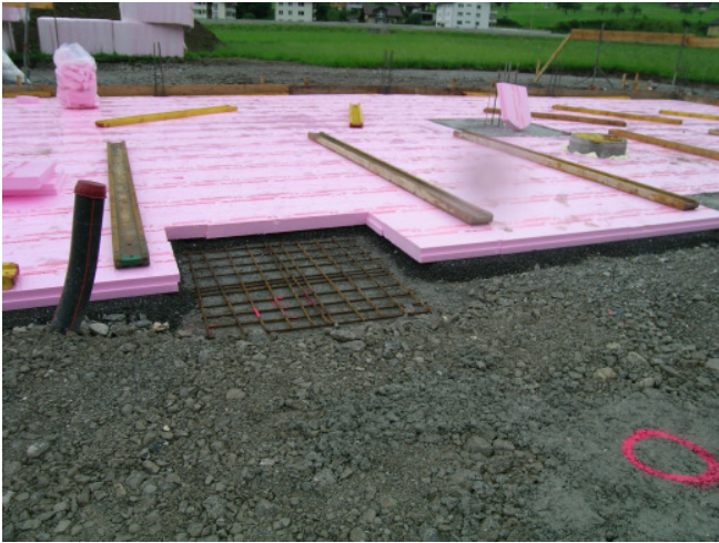
Wärmedämmung unter Bodenplatte