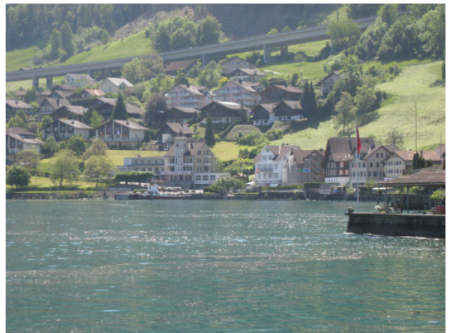
Liegenschaft von der Schiffstation her gesehen