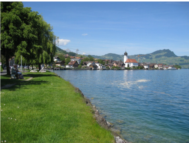
Öffentliche Promenade mit Bademöglichkeit