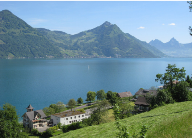
Traumaussicht auf Vierwaldstättersee, Schwyzerberge