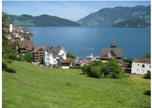
Blick in Richtung Dorf Beckenried, Vierwaldstättersee, Rigi