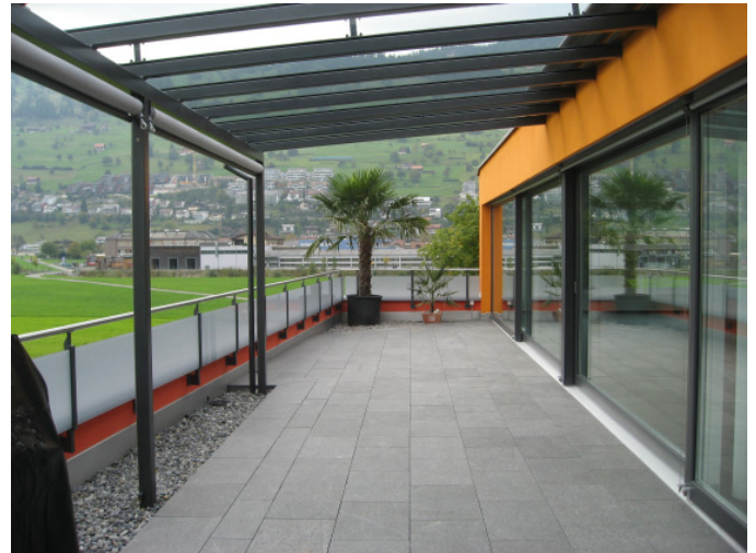
Leben auf der Terrasse...