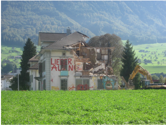
Abbruch Direktorenvilla, Baujahr ca. 1880