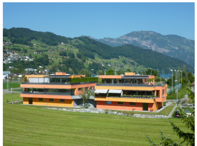
Wohnen im Naherholungsgebiet...