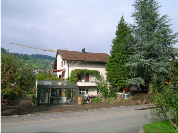
Bestehendes Haus / Überschwemmung 2005